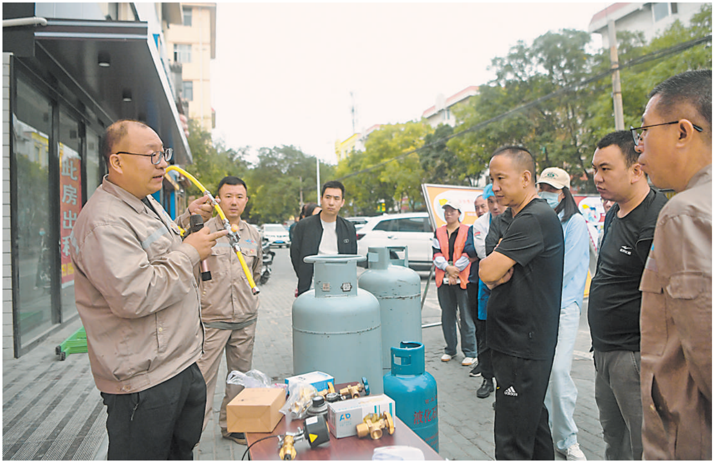
天天讲安全 9月6日，工作人员为居民讲解燃气瓶安全使用知识。当日，自治区市场监管厅特种设备检验检测院联合银川市兴庆区大庙社区居委会，向社区50余家商户及居民普及燃气安全使用知识。

宁夏首所医药卫生专科学校迎来首批学子 本报讯（见习记者 张适清）9月9日，全区首所医药卫生类专科学校——宁夏卫生健康职业技术学院迎来首批1000名新生。 宁夏卫生健康职业技术学院是经自治区政府批准、教育部备案，由自治区教育厅、自治区卫生健康委、石嘴山市政府共同主办，石嘴山市政府主管，自治区“十四五”高校设置规划建设重点院校。学院规划办学规模1万人、建筑面积26万平方米，项目分四期建设。目前，一期完成投资3.84亿元，建设专业实训室24个，8月底已完成建设，配备专任教师70人，开设护理、药学、康复治疗技术等五个专业，可满足2000名高职在校生教学、实训及生活需要。 宁夏卫生健康职业技术学院与宁夏医科大学、自治区第五人民医院、石嘴山市中医院及健康养老机构和药企等30余家企事业单位建立了科教、产教合作关系，为我区高质量培养卫生健康类人才打下了良好基础。后续将增设临床医学、口腔医学、医学检验技术等专业，培养覆盖主要医学专业领域的各类专业医学类人才，服务自治区“六新六特六优”产业，发挥人才优势推动我区康养产业高质量发展。