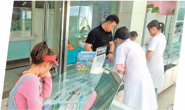
小朋友在选择镜框。