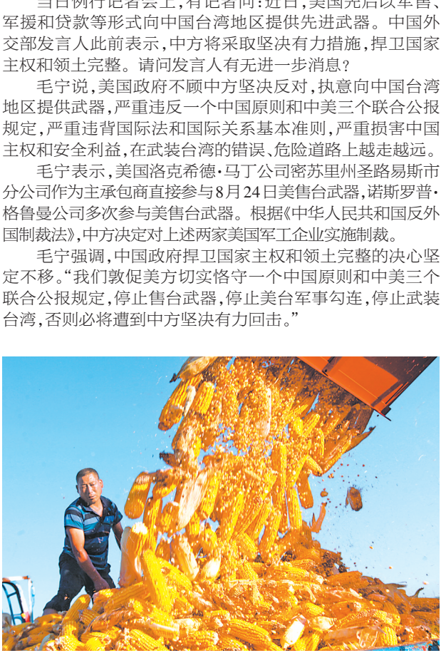
9月15日,在山东省临沂市平邑县铜石镇广阜村,农民将收获的金秋时节。当日,各地农民抢抓晴好天气忙收获,田间地头一派繁忙景象。 新华社发

新华社北京 9 月 15 日电 针对美方近期向中国台湾地区提供先进武器一事,外交部发言人毛宁 15 日说,根据《中华人民共和国反外国制裁法》,中方决定对美国洛克希德·马丁公司密苏里州圣路易斯分公司和诺斯罗普·格鲁曼公司实施制裁。 当日例行记者会上,有记者问:近日,美国先后以军售、军援和贷款等形式向中国台湾地区提供先进武器。中国外交部发言人此前表示,中方将采取坚决有力措施,捍卫国家主权和领土完整。请问发言人有无进一步消息? 毛宁说,美国政府不顾中方坚决反对,执意向中国台湾地区提供武器,严重违反一个中国原则和美中三个联合公报规定,严重违背国际法和国际关系基本准则,严重损害中国主权和安全利益,在武装台湾的错误、危险道路上越走越远。 毛宁表示,美国洛克希德·马丁公司密苏里州圣路易斯分公司作为主要承包商直接参与 8 月 24 日美售台武器,诺斯罗普·格鲁曼公司多次参与美售台武器。根据《中华人民共和国反外国制裁法》,中方决定对上述两家美国军工企业实施制裁。 毛宁强调,中国政府捍卫国家主权和领土完整的决心坚定不移。“我们敦促美方切实恪守一个中国原则和美中三个联合公报规定,停止售台武器,停止美台军事勾连,停止武装台湾,否则必将遭到中方坚决有力回击。”