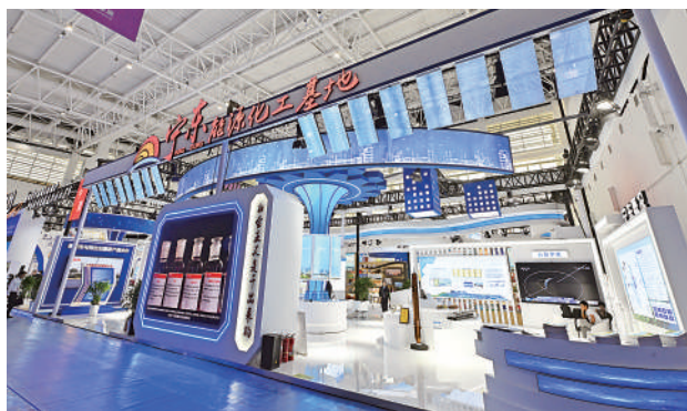
宁夏能源化工基地展区。