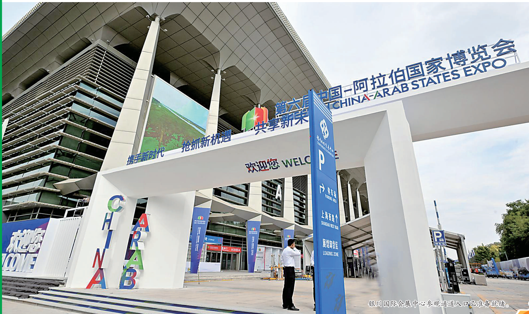
银川国际会展中心参观通道入口已准备就绪。