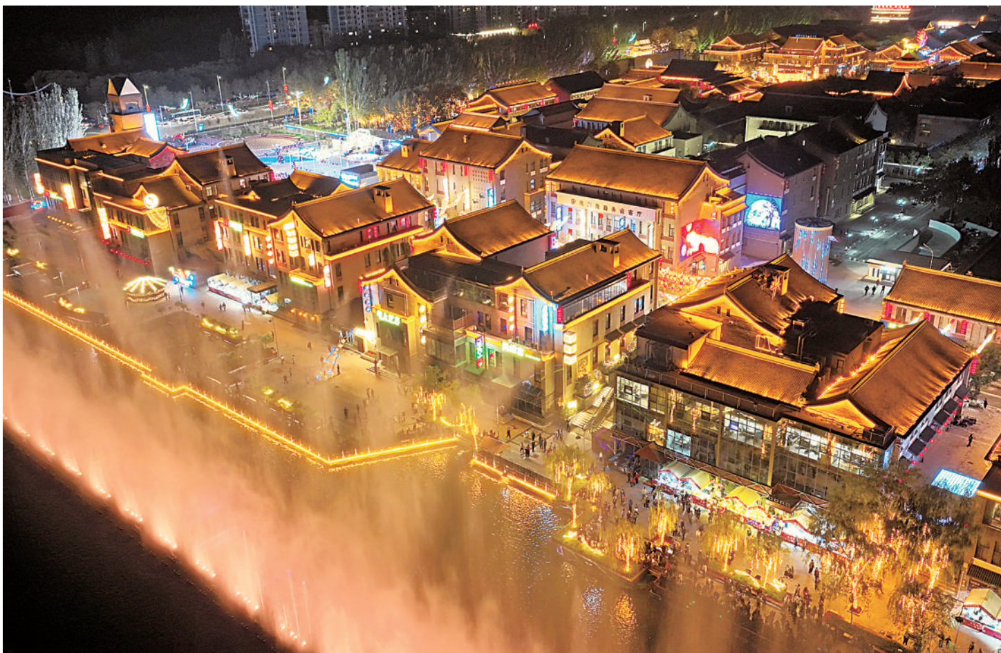
10月5日,银川文化城凤凰幻境夜景。