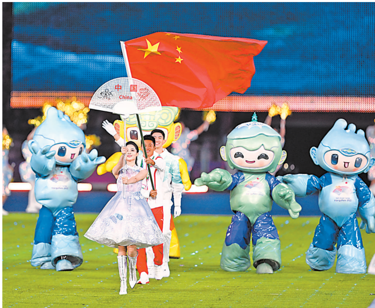
10月8日，中国代表团旗帜在闭幕式上入场。当日，杭州第19届亚洲运动会闭幕式在杭州奥体中心体育场举行。