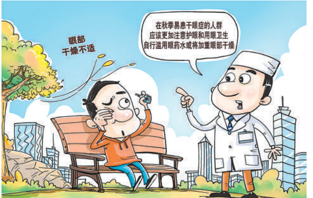
秋季气候干燥,眼部水分蒸发快,容易造成眼部干燥不适。每年10月的第二个星期四是世界视力日。专家认为,在秋季易患干眼症的人群,更应该注意护眼和用眼卫生,自行滥用眼药水或将加重眼部干燥。