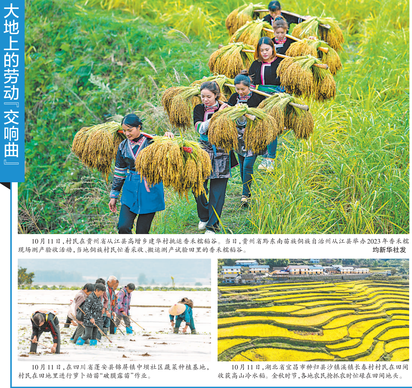
10月11日,村民在贵州省从江县高增乡建华村挑运香禾糯稻谷。当日,贵州省黔东南苗族侗族自治州从江县举办2023年香禾糯现场测产验收活动,当地侗族村民忙着采收、搬运测产试验田里的香禾糯稻谷。

随着中国经济复苏步伐加快,各大互联网平台企业表现出较强的增长势头。百度今年一季度营收同比增长9.62%,二季度实现同比增长14.87%;京东集团在2022年营收突破万亿元之后,2023年上半年同比实现