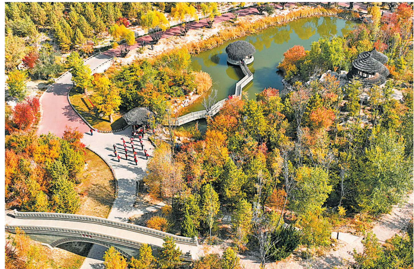
10月26日，银川贺兰山运动休闲公园，层林尽染，秋意正浓。通过对采石矿坑的生态修复治理，如今这里已成为集生态旅游、运动休闲和葡萄酒文化体验于一体的城市郊野休憩地。

的生态文明建设领域“1+4”系列文件进行辅导。现场党员干部一致表示，这次宣讲具有很强的理论性、实践性和指导性，更加深刻领会到习近平生态文明思想的丰富内涵，更加认识到美丽宁夏建设的紧迫性必要性，下一步，将立足自身岗位，以实际行动为建设天蓝地绿水美的美丽宁夏贡献力量。