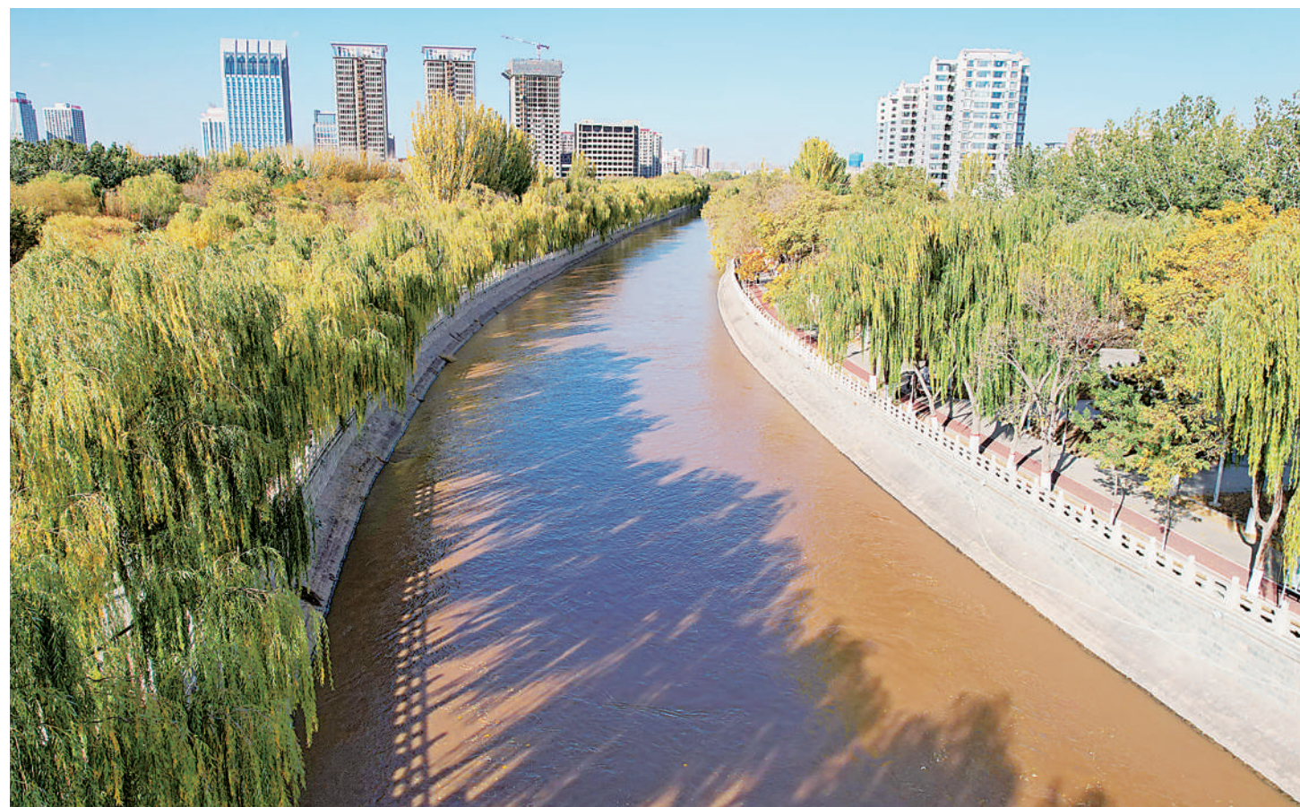
10月30日,唐徕渠银川城区段。冬灌期间,唐徕渠计划引水2.04亿立方米,含河湖湿地生态计划取水2682万立方米,灌溉面积92万亩。

德邦快递宁夏大区相关负责人表示,将坚守服务规范,确保大促期间高品质末端服务不打折。针对商家推出“一单多件、齐套配送”“多仓发货、统一结算”等服务,助力降本增效。