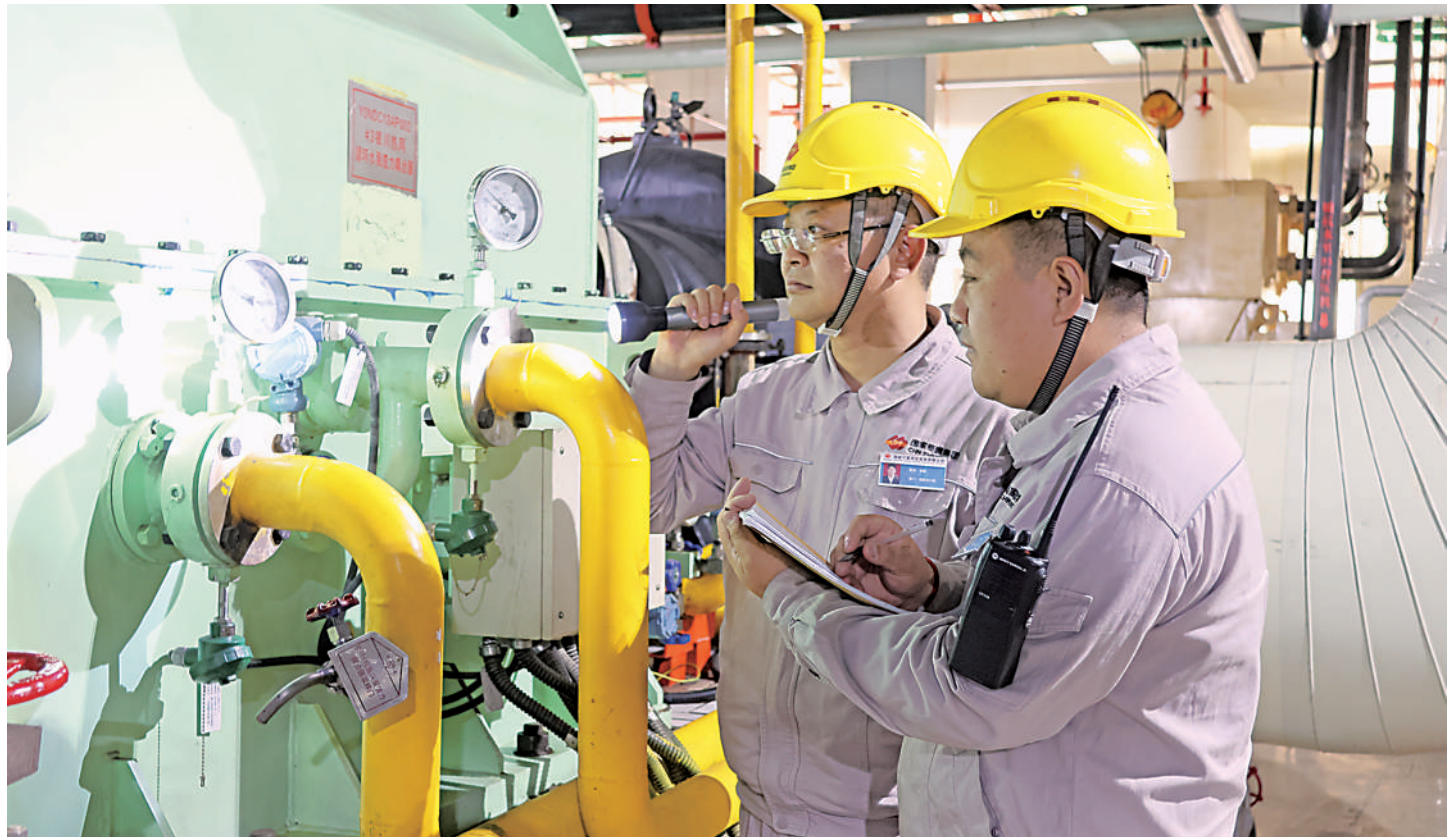
11月12日,国能宁夏灵武发电有限公司供热运行人员检查银川3号热网循环水泵运行状况。面对寒潮天气,该公司加大巡检次数,对热网首站、热网加热器等供热设备提级管控,进行24小时运行特护,全力保障供热安全可靠。

进一步养山富山,实现人与自然的和谐相处。”杨青龙说,固原市将把拓宽绿水青山转化金山银山路径作为重要课题,重点有3条转化路径:一是大力发展文旅产业,固原的春季是山花烂漫,夏季是青山叠翠,秋季是层林尽染,冬季是水墨丹青,四季都是美的,持续写好“宁静、凉爽、古色”文章,让高颜值实现高价值;二是大力发展林下种植养殖如林鸡、林蜂、菌菇等生态经济,把绿水青山的“看点”变成增收富民的“卖点”,让更多“绿色颜值”转化为“金色产值”;三是充分挖掘林草资源的增加值,启动全国林业碳汇试点市建设,推进碳汇交易,建立横向生态补偿机制,让“谁建设谁受益、谁受益谁补偿”真正落到实处。