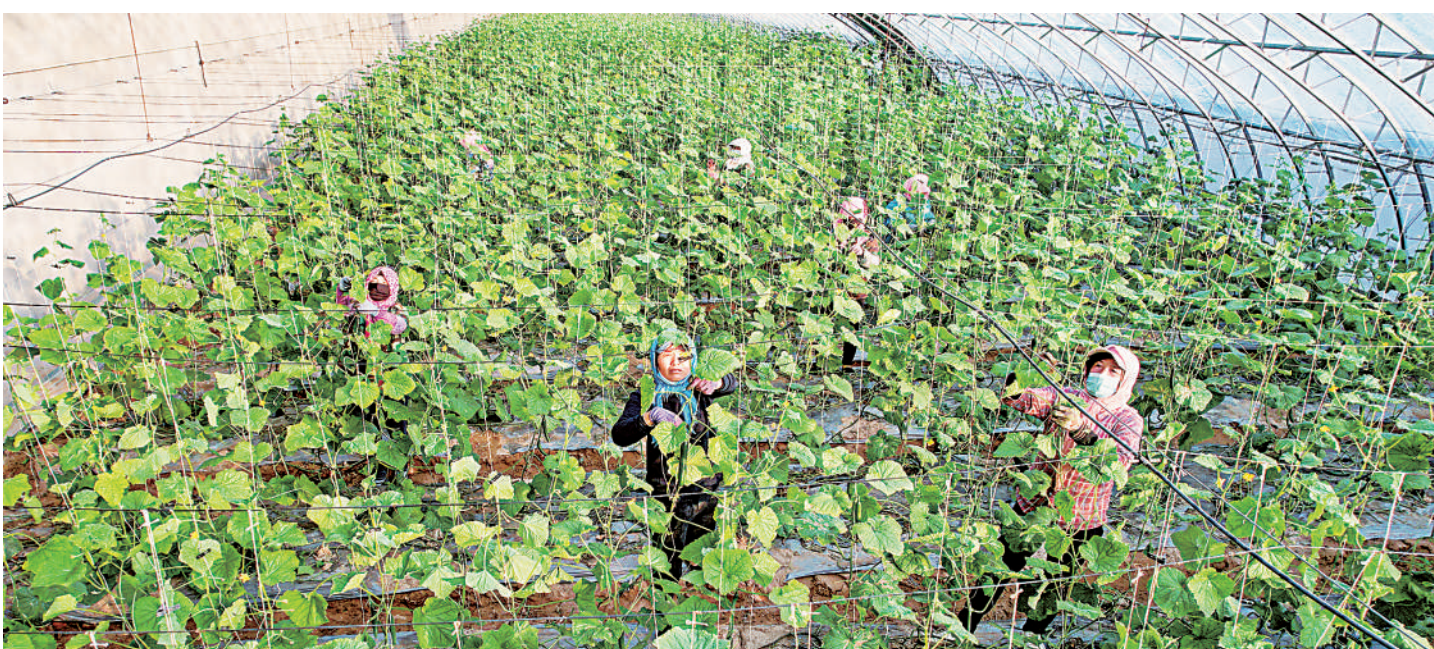
11月26日,石嘴山市大武口区星海镇隆惠村百果园“三个零”技术示范产业园现代化日光温棚内,一根根水果黄瓜错落有致地挂在叶间,农户忙碌其间。该产业园建在盐碱地上,采用零化学肥料、零化学农药、零化学激素的种植方式,产出的水果黄瓜在上海、深圳、广州等地供不应求。本报记者 王晓龙 摄

本报讯(记者 朱立杨)《宁夏回族自治区事故隐患自查核查督查调查检查“六查”责任倒查办法(试行)》近日印发。办法指出,事故隐患“六查”责任倒查坚持“管行业必须管安全、管业务必须管安全、管生产经营必须管安全”等原则,全面落实事故隐患排查、改、督、销各方主体责任,形成安全生产“所有事”全领域覆盖、“一件事”全链条管控、“落实事”全过程监管和事故隐患发现、建账、整改、确认、分析、考评等闭环管理机制。 办法坚持问题导向,注重上下衔接,针对部分地区和行业存在的安全隐患排查治理责任落实不够到位、程序执行不够规范、验收复查不够严格等问题,围绕安全隐患“一件事”全链条明确谁来查、查什么、怎么查。同时,压实企业隐患排查治理主体责任,明确各类生产经营单位是安全隐患自查、排查的责任主体,主要负责人是第一责任人。各级人民政府、行业管理部门和安监部门是安全隐患核查、督查、调查、检查的责任主体,对“六查”负有检查指导和监督管理责任。 办法自2023年12月9日起施行。