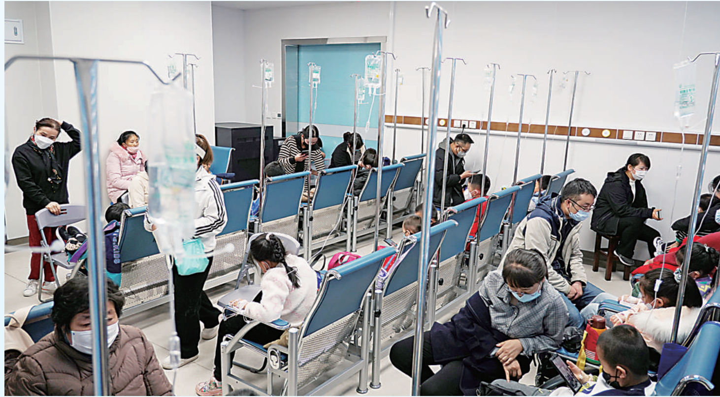
在宁夏中医医院暨中医研究院输液室内,输液治疗的小患者非常多。