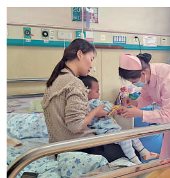
银川市第一人民医院儿内科护士为患儿扎针输液。

“对于肺炎支原体感染,以及引发的高热、咳嗽、肺炎等,中医结合患儿体质,采用汤剂或者外治法,均可获得不错的疗效。”王惠敏表示,2023年版《儿童肺炎支原体肺炎诊疗指南》中提到,根据辨证施治原则,支原体肺炎可以联合使用清热宣肺等中药治疗。中医治疗支原体肺炎等呼吸道感染性疾病除了中药内服,还有很多特色的外治法。例如小儿推拿、穴位贴敷、吸痧走罐、中药熏洗、刺络放血等。“如果孩子得了支原体肺炎,要用到阿奇霉素,中医认为抗生素属于寒凉物质,寒凉容易伤脾胃。可采取一些食疗的方式呵护孩子的脾胃,提高抵抗力。”王惠敏说。