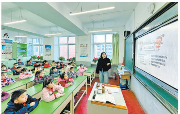
12月4日是第十个国家宪法日,银川市兴庆区唐徕小学主题班会上,老师为孩子们开展普法教育。当日,唐徕小学举办了“与法同行,护航成长”主题活动。