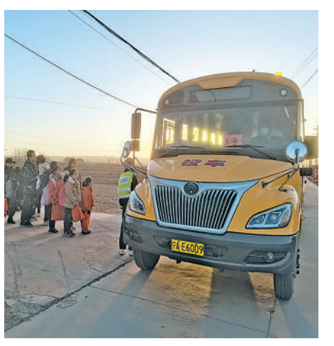
孩子们准备乘坐校车。