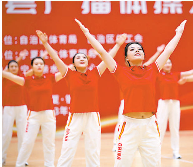
12月9日,由自治区体育局和自治区总工会主办,宁夏社会体育服务中心承办的第九套广播体操大赛在银川落下帷幕,共有57家单位1175名选手报名参赛。

宁夏日报新闻职业道德 监督热线 0951-6030129 (机关纪委) 0951-6033843 (全媒体指挥中心)