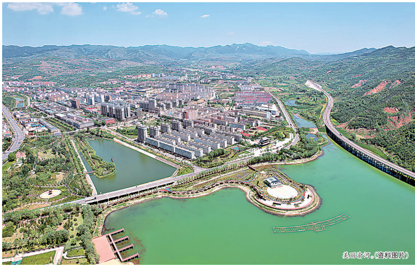
美丽渝河。(资料图片)