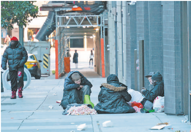
这是12月23日在美国加利福尼亚州旧金山街头拍摄的无家可归者。美国住房和城市发展部15日发布的2023年度报告显示,美国现阶段无家可归者人数超过65万人,创2007年开始统计这一数据以来新高。