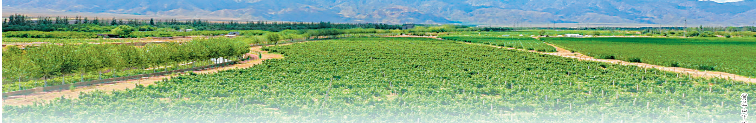
贺兰山下万亩葡萄园。