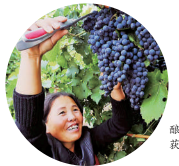
西夏区酿酒葡萄喜获丰收。

从高空俯瞰,贺兰山下的一座如茉莉花形状的建筑格外引人注目。这是由酒仙集团在宁夏投资的茉莉花酒庄,一期规划建设1000亩高质量有机葡萄园,目前已完成土壤改良、蓄水池建设、水肥一体化设施铺设等工作。2023年6月,第一批314亩赤霞珠葡萄苗木种下。酒仙集团相关负责人介绍,2024年,茉莉花酒庄将做精做细葡萄园、绿化美化葡萄园,还会将剩余416亩葡萄田规划种植美乐、马瑟兰、品丽珠等葡萄品种。