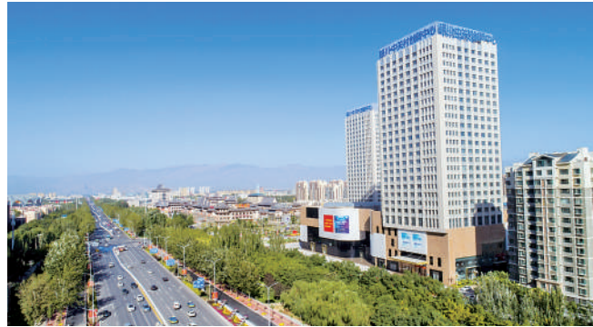
西夏区奋力打造银川科创新城。