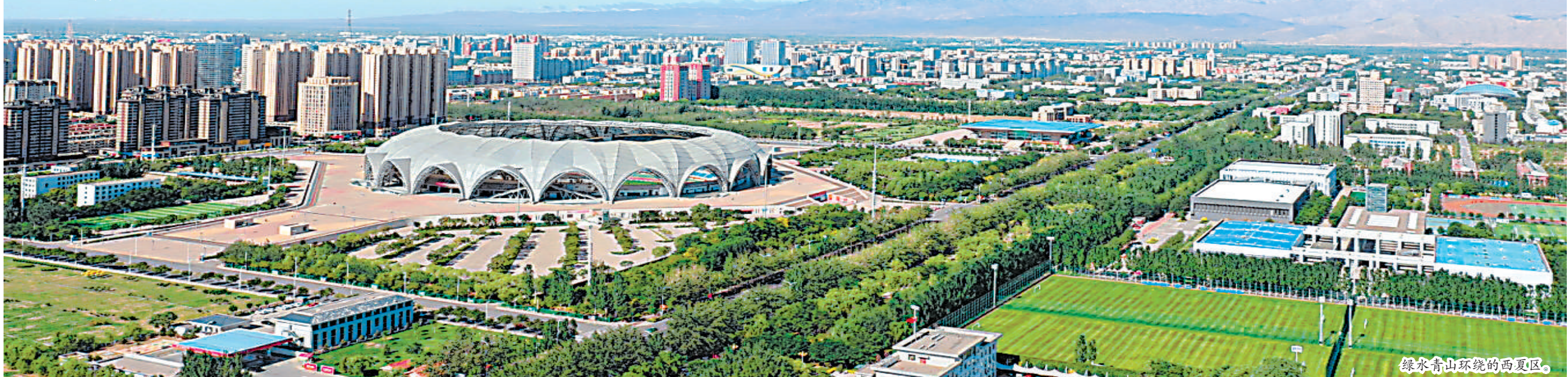
绿水青山环绕的西夏区。