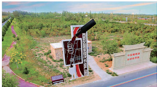
西夏区国家现代农业产业园。