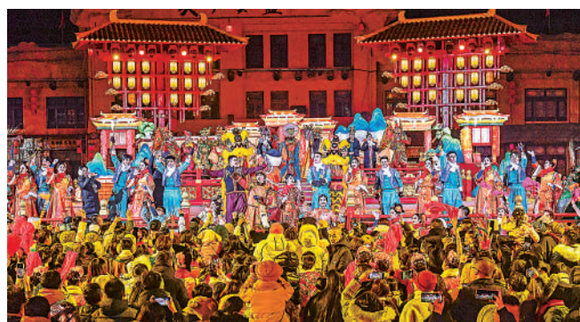
漫葡·看见贺兰山沉浸式演艺(冬季版)现场。