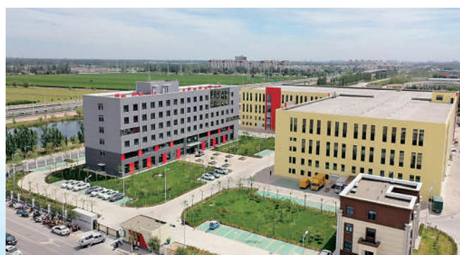
杞里香健康产业园。