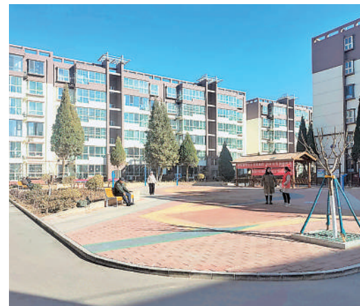
改造后的青铜峡市老旧小区焕发新颜。

患有外表破损、配套设施滞后、管理混乱等“老年病”的小区,改造后楼顶重新铺设了防水层,破旧损坏的太阳能热水器也被拆除,“一揽子”解决了漏水难题。像这样“对症下药”的改造,得益于青铜峡市在老旧小区改造过程中,充分尊重居民意愿,始终把群众急难愁盼放在首位。