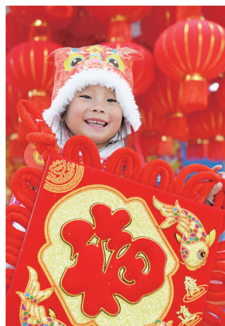
↑2月7日,在云南丽江象山市场,一名小朋友在挑选新春装饰品。 新华社发