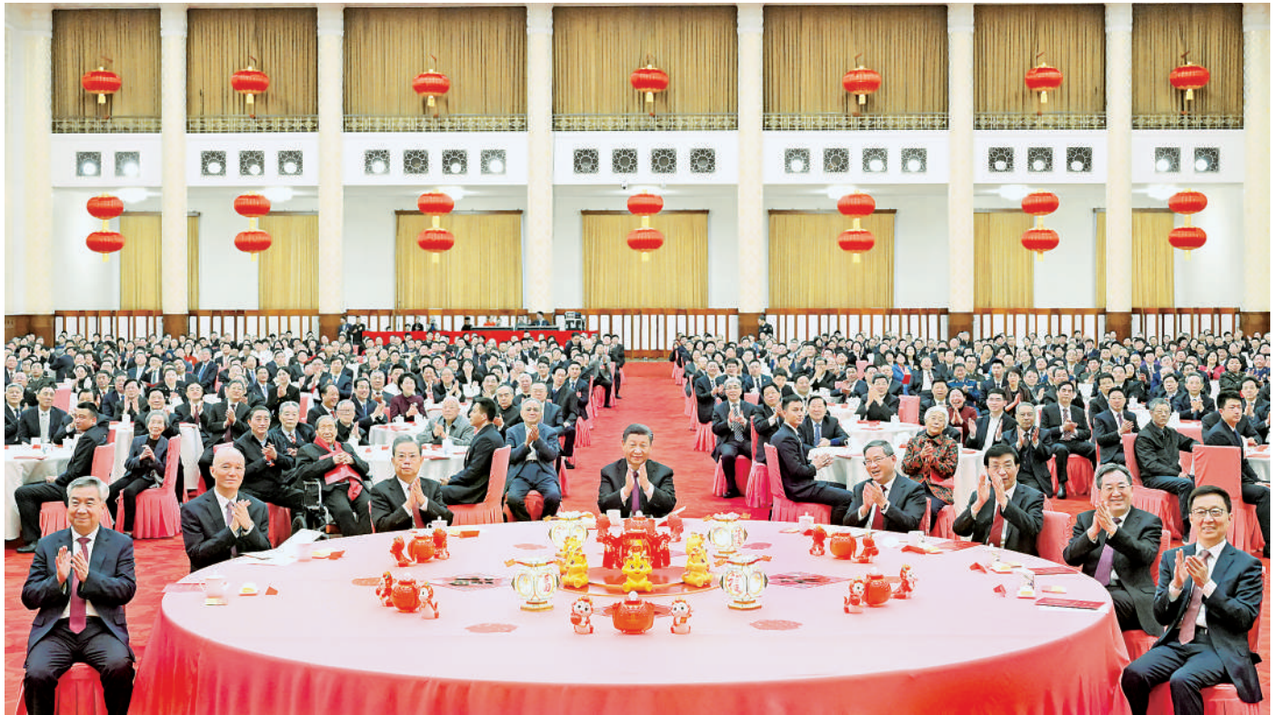
2月8日，中共中央、国务院在北京人民大会堂举行2024年春节团拜会。党和国家领导人习近平、李强、赵乐际、王沪宁、蔡奇、丁薛祥、李希、韩正等同首都各界人士齐聚一堂，共迎新春。

新华社北京2月8日电 中共中央、国务院8日上午在人民大会堂举行2024年春节团拜会。中共中央总书记、国家主席、中央军委主席习近平发表讲话，代表党中央和国务院，向全国各族人民，向香港特别行政区同胞、澳门特别行政区同胞、台湾同胞和海外侨胞拜年。