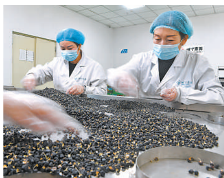
永宁县闽宁镇原隆村承美电商扶贫车间,工作人员在分拣包装黑枸杞。