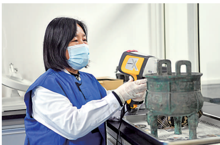
宁夏博物馆工作人员用便携式X射线荧光光谱仪检测青铜鼎合金成分及化学元素。