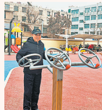
朝晖小区改造完后,老人们在这里锻炼身体。