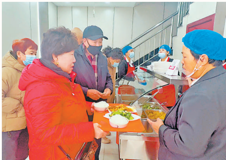
万盛社区食堂里老人排队打饭。