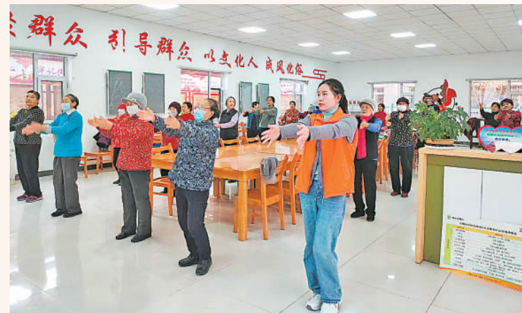
社区助老员带领老年人做操。

近年来,大武口区不断加大老年人的生活健康、精神文化等需求供给,积极开展示范性老年友好型社区创建,发挥社区卫生服务站、物业公司等组织优势,以老年人需求为导向,提升家庭医生签约率,开设老年大学,开展丰富多彩的文化活动,将为老服务工作拓展到居民身边,让老年人老有所养、老有所乐。