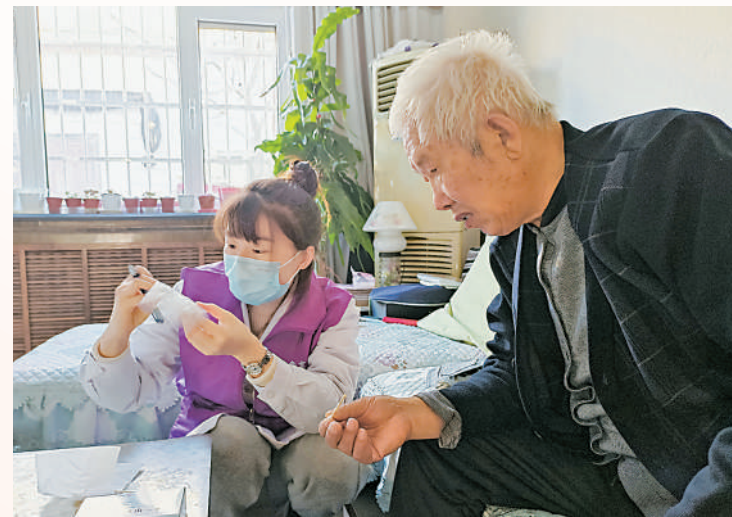
家庭药师指导老人用药。