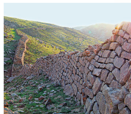
内蒙古包头市固阳秦长城天盛成段。

全国人大代表,包头市委副书记、市长张锐告诉记者,除战国赵北长城、固阳秦长城,包头市还有汉外长城南北线、北魏六镇长城南北线以及金界壕主线和漠南线,共5个时代8条长城,总长度约720千米。 “我们始终把保护放在第一位,《包头市长城保护条例》《关于全力打造新时代文化高地的实施意见》等都为长城的保护提供了有力的理论依托。”张锐说,一系列长城主题文化活动让人们踱过历史长河,重新读懂长城。 “要充分发挥文化与科技的‘化学反应’,数字化展示文物和文化资源,以‘文旅IP思维’实现线上线下协同发展,让长城文化更好润泽群众生活。”张锐说,将不断探索和创新长城文化现代表达方式,让古老文化瑰宝在新时代焕发出勃勃生机与活力。