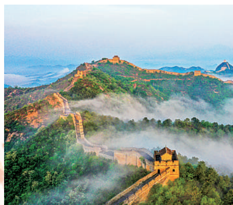
河北金山岭长城。