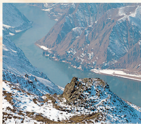
黄河黑山峡观音崖烽火台。