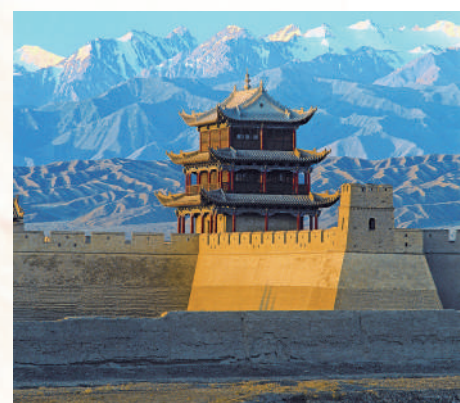
甘肃嘉峪关长城。

突破并掌握了很多土质长城保护关键技术,给长城保护提供了技术底气。” 除了汪万福说到的国家古代壁画与土遗址保护工程技术研究中心,近年来,在甘肃省有关市州、县区,还有一大批长城保护管理研究专业机构“应运而生”。 对长城保护而言,除了科技赋能,长城法规的建设完善同样不能少。《甘肃长城保护总体规划》已编制完成,《甘肃省长城保护条例》《玉门关遗址保护管理办法》等法规也相继出炉。 “我们一直把‘文化遗产人人可及’当成努力的方向。”汪万福说。近几年,甘肃利用文化和自然遗产日、国际古迹遗址日等时间节点广泛宣传长城价值,集中展示长城保护成果,让更多的人意识到保护长城从自己做起。