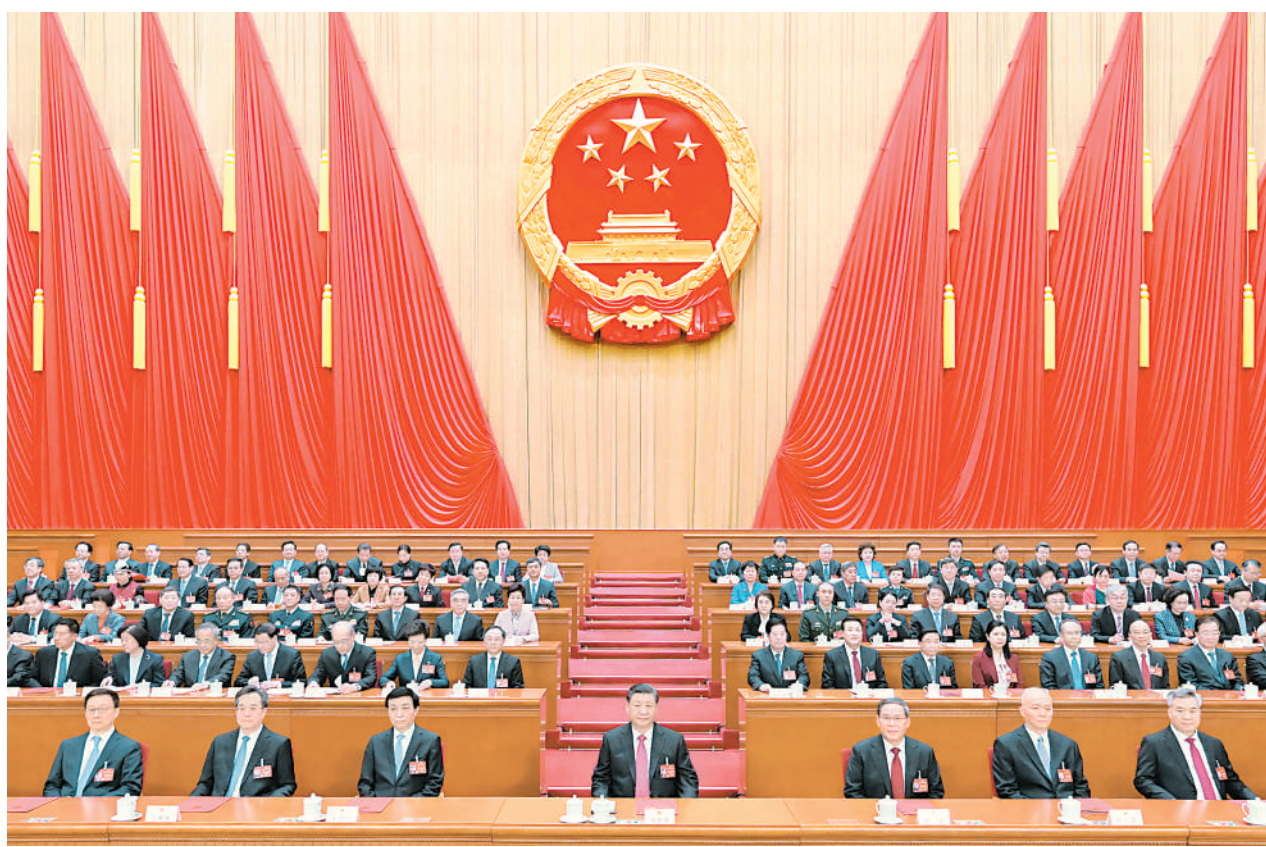
3月11日，第十四届全国人民代表大会第二次会议在北京人民大会堂闭幕。党和国家领导人习近平、李强、王沪宁、蔡奇、丁薛祥、李希、韩正等在主席台就座。