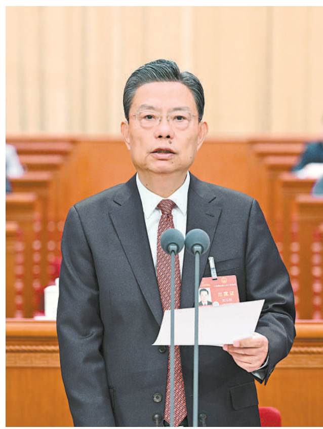
大会主席团常务主席、执行主席赵乐际主持闭幕会并讲话。

项任务，努力实现全年经济社会发展目标，具有十分重要的意义。我们要在以习近平同志为核心的党中央坚强领导下，坚持以习近平新时代中国特色社会主义思想为指导，同心同德，凝心聚力，团结奋斗，坚定不移推进中国式现代化。要践行以人民为中心的发展思想，发展全过程人民民主，充分尊重人民所表达的意愿、所创造的经验、所拥有的权利、所发挥的作用，激发全社会创新创业创造的热情和活力，汇聚起团结奋斗的强大力量。要求真务实、真抓实干，攻坚克难、善作善成，努力克服一个又一个困难，办好一件一件实事，完成一项一项任务，在团结奋斗中不断实现人民对美好生活的向往。