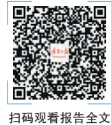
扫码观看报告全文

宪法实施和监督;完善中国特色社会主义法律体系;扎实有效做好监督工作;充分发挥人大代表作用;拓展深化人大对外交往;提升常委会自身建设水平。