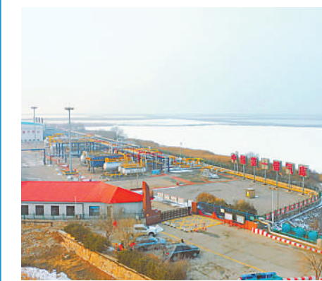
↑空中俯瞰大港油田大张坨储气库(无人机照片,2023年12月20日摄)。

大港油田板南储气库运维工程师在生产装置区查看设备设施运行状态(2024年3月10日摄)。