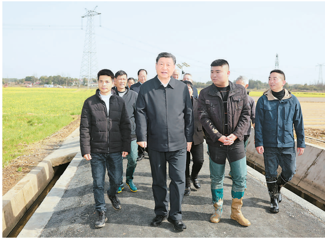
3月18日至21日,中共中央总书记、国家主席、中央军委主席习近平在湖南考察。这是19日下午,习近平在常德市鼎城区谢家铺镇港中坪村,同种粮大户、农技人员、基层干部亲切交流。

新华社长沙3月21日电 中共中央总书记、国家主席、中央军委主席习近平近日在湖南考察时强调,湖南要牢牢把握自身在构建新发展格局中的战略定位,坚持稳中求进工作总基调,坚持高质量发展不动摇,坚持改革创新、求真务实,在打造国家重要先进制造业高地、具有核心竞争力的科技创新高地、内陆地区改革开放高地上持续用力,在推动中部地区崛起和长江经济带发展中奋勇争先,奋力谱写中国式现代化湖南篇章。