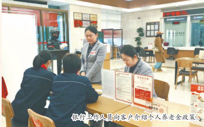
银行工作人员向客户介绍个人养老金政策。

计申报个人养老金税前扣除1844人次,申报金额1022.54万元。各商业银行在客户购买个人养老金产品时都能充分做好产品风险提示,要求客户在购买产品前仔细阅读产品说明书和风险提示书,对购买产品务必做到充分了解。通过建立和完善投诉机制,积极发挥社会监督作用,更好地服务个人养老金实施。