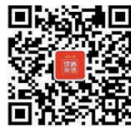
扫码进入宁夏日报读者来信微信公众号