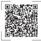
扫码观看新闻视频