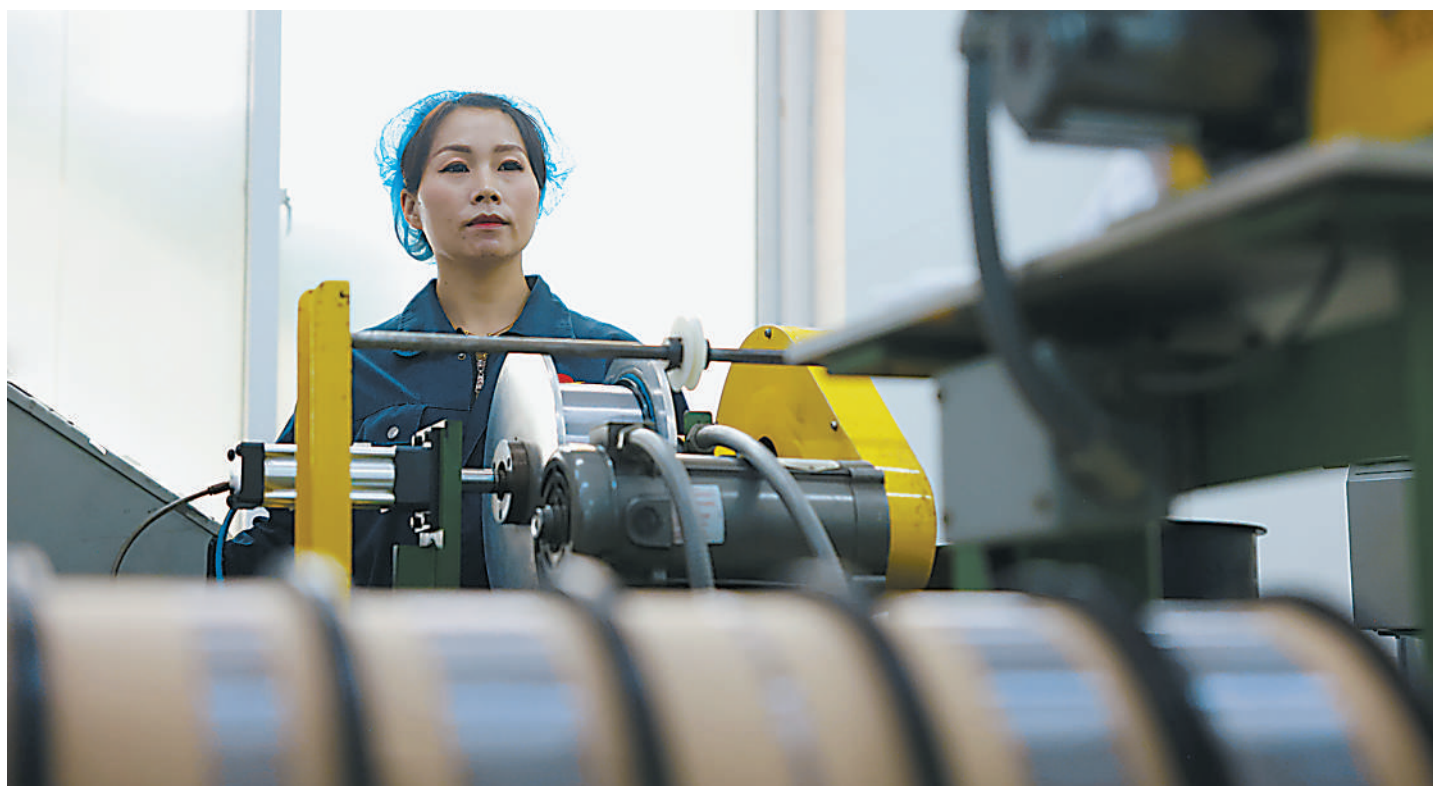
3月30日,中色(宁夏)东方集团有限公司铝丝分厂职工在生产线上作业。今年前2个月,该公司排除外部市场干扰,生产经营总体平稳,经营效益再创同期最好水平。

中心为企业量身定制了集装箱液袋运输方案,降低了物流成本,经测算,每个集装箱能节省7000元费用,此次货物发运为企业节约物流成本35万元。 “今后,我们会在降低社会物流成本上持续发力,有序推进大宗货物中长距离运输‘公转铁’,加快建设内外联通、安全高效、智慧绿色的现代物流体系。”吴战强说。