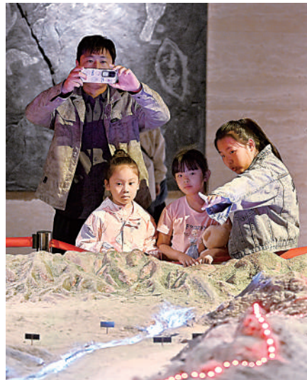
↑4月6日,游客在宁夏博物馆参观。清明节假期,全区图书馆、文化馆、博物馆、美术馆接待市民及游客4.61万人次。