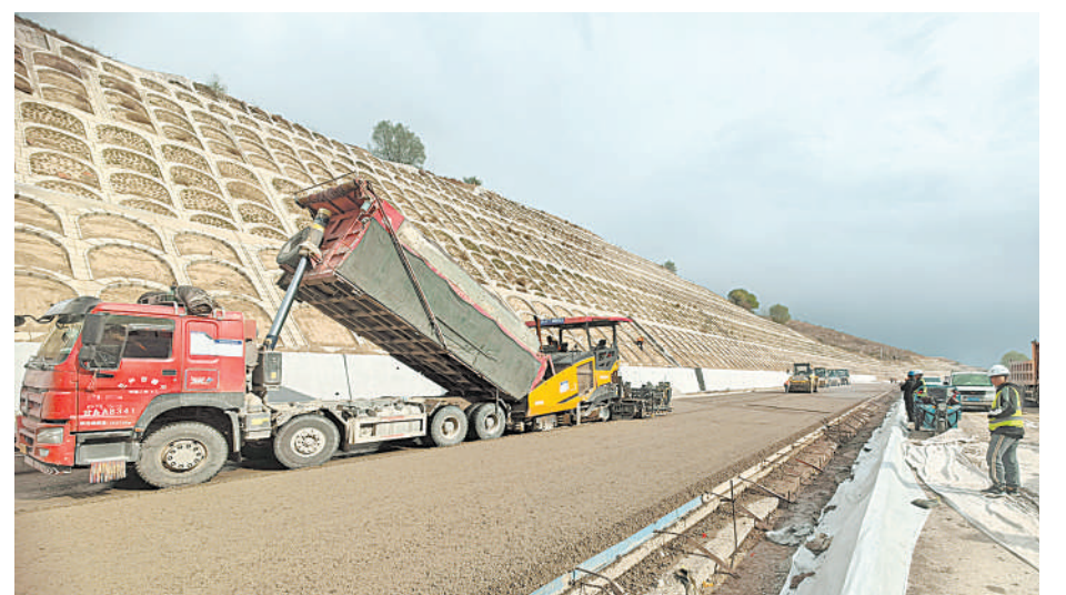
工人在紧张施工,全力以赴保项目进度。