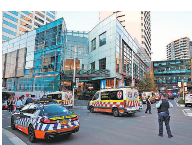
4月13日，在澳大利亚悉尼，警察在发生持刀袭击事件的商场外警戒。澳大利亚警方13日说，位于悉尼东南部邦迪路地区的一家商场当天发生持刀袭击事件，造成7人受伤，还有多人受伤，行凶者当场被警方击毙。 新华社发

小林制药问题保健品事件暴露出日本功能性标示食品制度的安全隐患。日本消费者厅计划在本次排查基础上，讨论修订相关制度，包括将报告健康受损相关信息定为生产商的义务等。