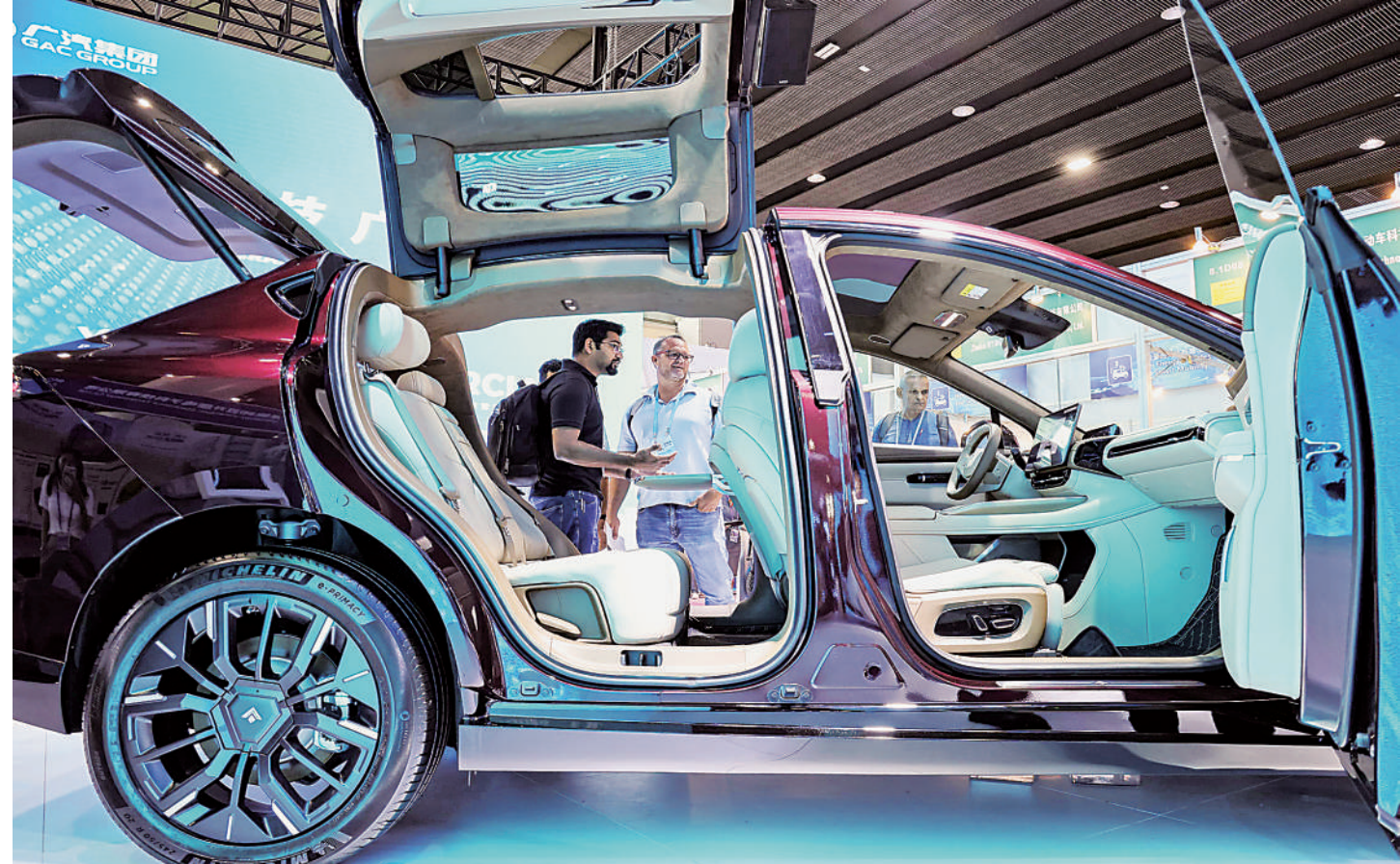
采购商在参观广交会上展示的中国新能源汽车(4月15日摄)。4月15日,第135届中国进出口商品交易会(广交会)开幕。本届广交会第一期于4月15日至19日举行,主题为“先进制造”。新能源汽车及智慧出行展区受到众多采购商青睐。针对境外采购商,广交会将举办新能源汽车的线下专场对接活动,助推中国新能源汽车“出海”。