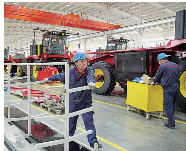
4月16日,在新疆塔城地区乌苏市的新疆塔城地区智能农机股份有限公司生产车间,工人在转运生产所需零件。 随着新疆天山南北广大棉区逐渐进入春耕春播阶段,位于新疆塔城地区乌苏市的新疆塔城地区智能农机股份有限公司内的采棉机生产车间进入生产高峰期,为秋季的棉花采收做好准备。