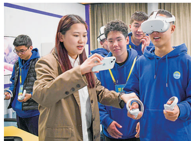
4月15日,参加春令营的来华青年学生在新疆师范大学学生(左二)的引导下体验VR等设施。

根据会议要求,在今年完成酒店电视治理工作阶段性任务基础上,将开展规范酒店电视信号源治理工作,提升酒店安全防护能力,确保电视信号安全优质传输。此外,也鼓励酒店充分利用超高清技术,通过升级电视设备、优化信号传输等方式,有效提高酒店电视的画质和清晰度,为旅客提供高质量的超高清视听内容,提升用户收视体验。