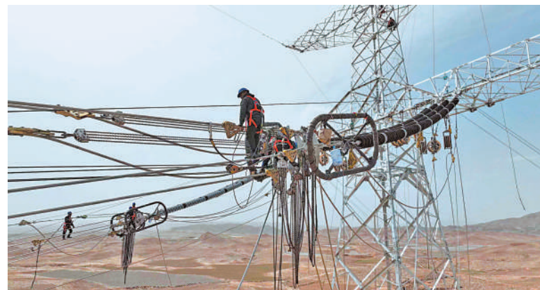
4月22日,中宁县徐套乡上流水村境内,承担宁夏—湖南±800千伏特高压直流输电线路工程宁1标段线路建设任务的宁夏送变电工程有限公司建设者在首段线路跨越施工。据悉,“宁电入湘”线路工程宁1标段提前放线段线路长2.7公里,这段线路将跨越黄河至白银7500千伏II回线路、110kV宁兴线、330kV白安线3条输电线路。4月28日,该段线路所有作业将全部完成。