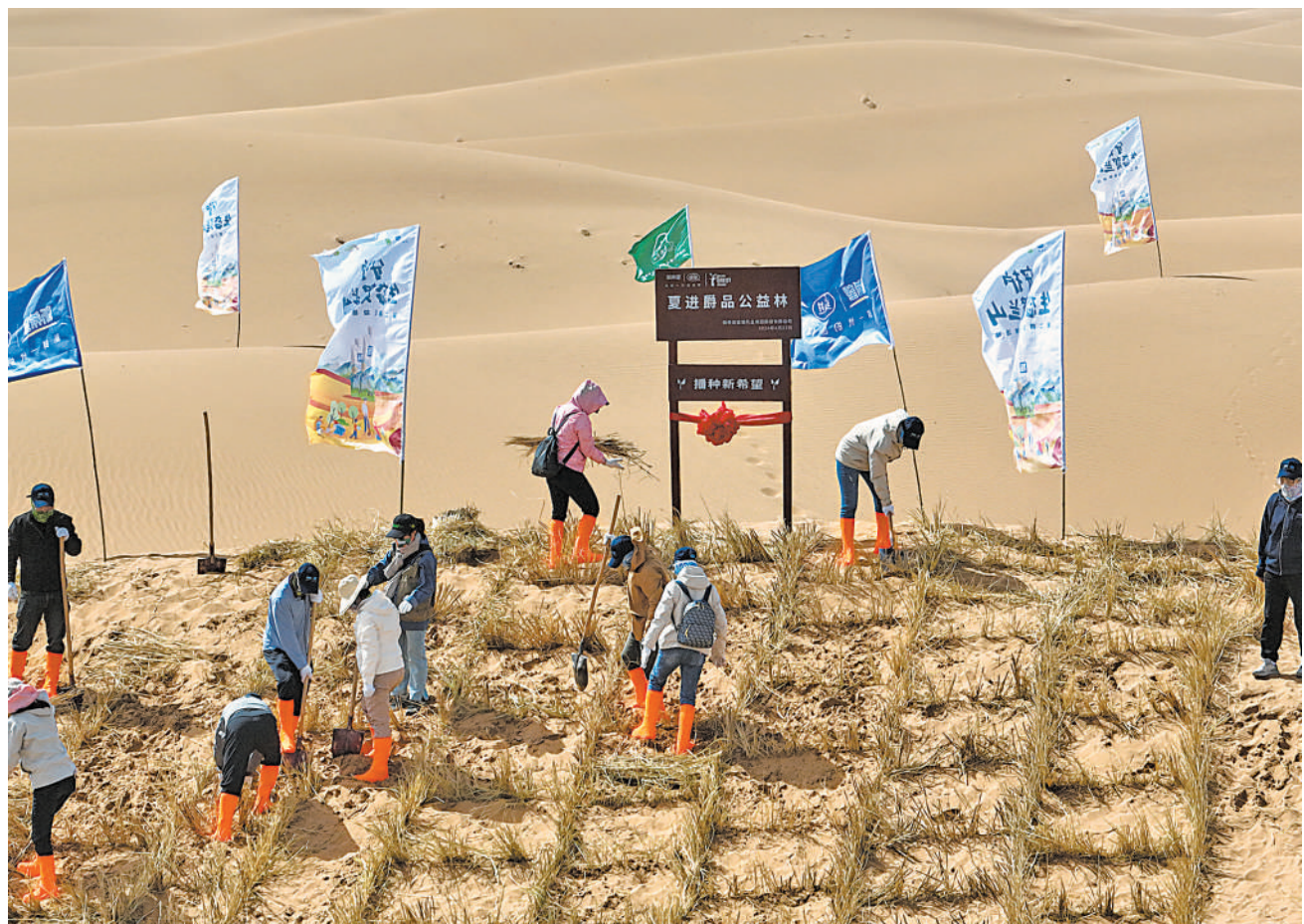
4月22日,世界地球日,宁夏复进乳业集团股份有限公司携手中国绿化基金会,在贺兰山麓的腾格里沙漠开展公益植树活动。

107项公证事项实行清单管理 宁夏提速公证「减证便民服务」 本报讯(记者 马忠)4月23日,固原市原州区彭堡镇蒋口村村民马某因退耕还林补贴申领事宜申请办理协议书公证,公证员压缩公证办理期限当场办结。今年,自治区司法厅与宁夏公证协会联合在全区公证行业开展公证减证便民提速活动,解决群众办理公证等待时间长、提供材料多、往返多次跑等问题。此次减证便民提速,是以事实清楚、证明材料充分为前提,分类压缩公证办理期限,能随时办理的实行“立等可取”,能当日办结的实行“1日可取”,对委托、遗嘱、保管等81个公证事项(事务)做到“5日取证”,对赠予、保全证据、登记等69个公证事项(事务)做到“10日取证”。梳理整合公证事项证明材料清单,对107项公证事项(事务)实行清单管理,做到“清单之外无证明”。搭配主动调查核实、信息共享、异地业务协作等获取证明材料方式,“容缺受理”“即申请即受理”等受理模式,让公证办理再提速。