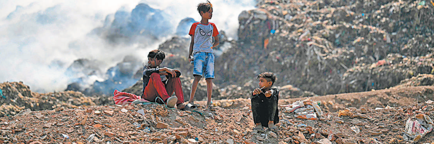
4月22日,在印度首都新德里,孩子们聚集在冒烟的加吉布尔垃圾填埋场附近。4月22日是第55个世界地球日。垃圾处理不当带来的环境问题是地球面临的挑战之一。

金正恩同时强调,要不断提高核武力在战争遏制战略和战争执行战略中的中枢作用,并朝此方向完善战法及核武力经常性备战态势。