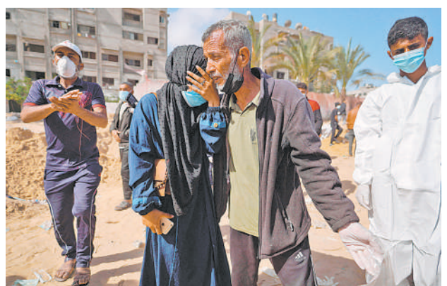
4月21日,在加沙地带南部城市汗尤尼斯的纳赛尔医疗中心,人们哀悼遇难的亲属。巴勒斯坦加沙地带民防部门说,自4月19日以来,在以色列军队撤离后的汗尤尼斯市纳赛尔医疗中心发现近300具尸体。

文章援引美国外交关系协会研究员伊努·马纳格的话说,美国不应采取关税保护措施,“因为你(这么做)在限制自己市场的竞争力”。