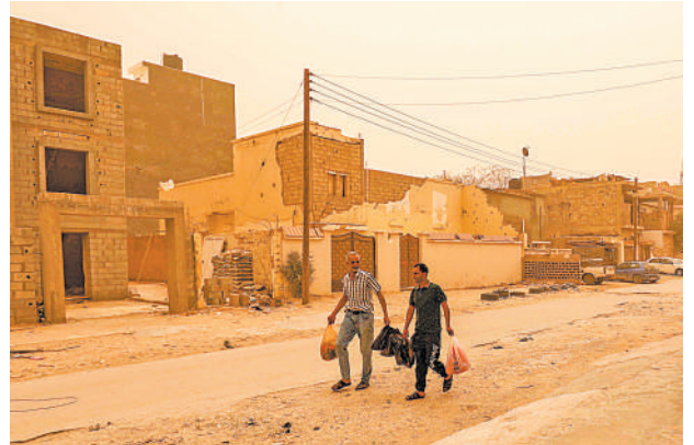
4月22日,行人走在遭沙尘暴侵袭的利比亚东部城市班加西街头。利比亚东部地区4月22日遭强烈沙尘暴侵袭,当地机场、行政机构和学校临时关闭,空中交通一度中断。