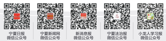
宁夏日报 宁夏新闻网 宁夏都市报 宁夏法治报 小九人学习报