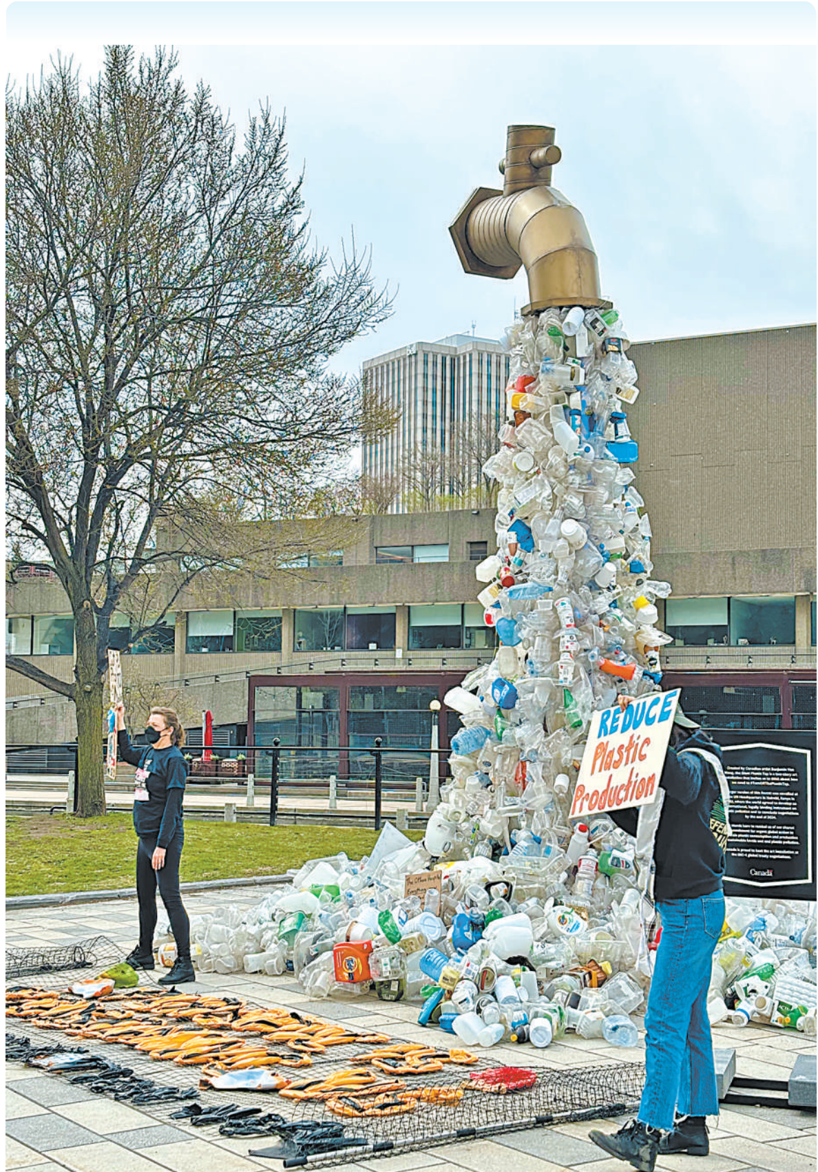
4月23日,在加拿大首都渥太华,人们站在一处设立于谈判会场附近的装置艺术作品——巨型塑料水龙头前。为期一周的联合国治理塑料污染新一轮谈判23日在加拿大首都渥太华正式开始。联合国环境规划署表示,此轮谈判必须取得有意义的进展。