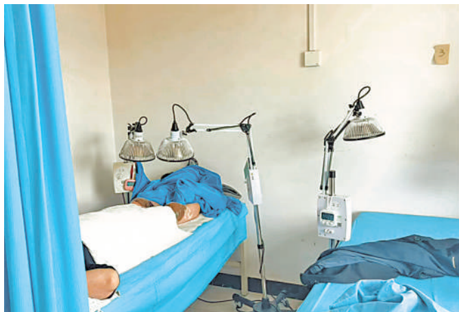
居民在社区卫生服务中心做中医理疗。