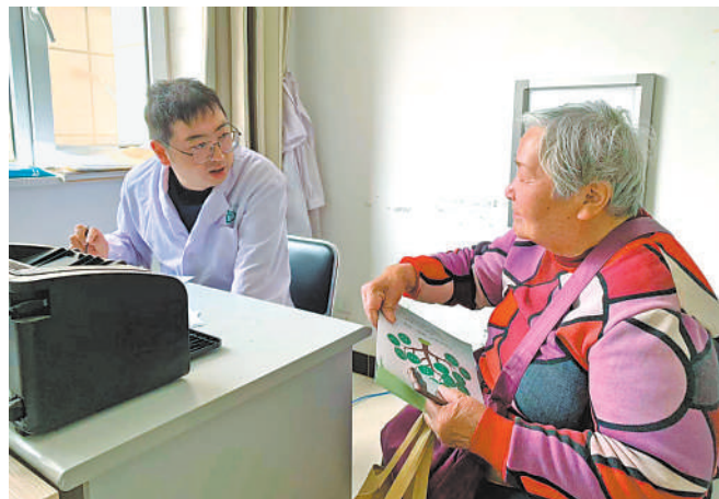
银川市第三人民医院医生在文化街社区卫生服务中心坐诊。

家门口的社区医院能看啥病,在社区医院看病有哪些便利和优势,能否满足社区居民的基本医疗服务需求,记者对此进行采访。