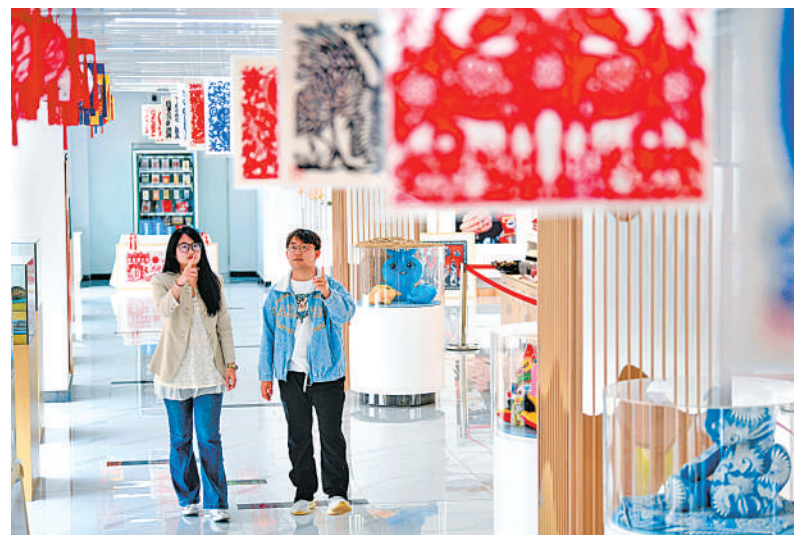
银川市非物质文化遗产展示中心展示了剪纸、麻编、口弦、泥塑、葫芦烙画、贺兰砚等数十项非物质文化遗产作品,形象、系统地展示非遗的魅力。