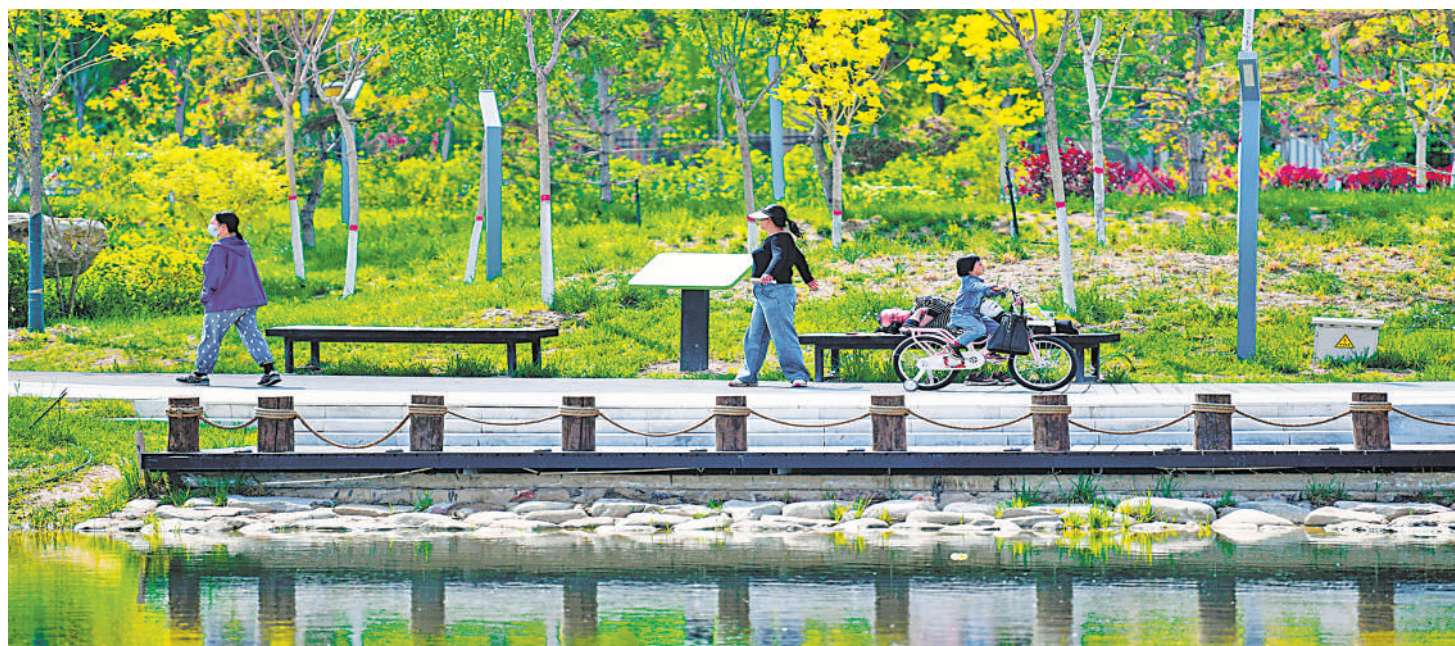
5月5日,人们穿行在银川市金凤区罗家湖公园。近年来,银川市高质量推进小微公园建设,扮靓城市空间。截至2023年年底,银川市累计建成小微公园106个。本报记者 马楠 摄

一季度宁夏农产品出口4.4亿元 枸杞出口值居全国同类商品第一 葡萄酒出口金额同比增长336.5% 本报讯(记者 王瑞)记者近日从银川海关获悉,今年一季度,我区农产品出口4.4亿元,同比增长30.2%,其中出口冷冻马铃薯、枸杞分别达0.7亿元、0.5亿元,分别增长9.8%、9.4%,分别占全国同类商品出口值的17.2%、30.2%。出口值分别位居全国第三和第一。 从农产品类型来看,一季度,冷冻蔬菜出口6525吨,金额5680万元,同比增长77.2%、60.1%;枸杞出口944吨,金额5254万元,同比增长11.2%、9.4%;葡萄酒出口28790升,金额341万元,同比分别增长228.1%、336.5%。 宁夏的气候环境和地理资源有利于畜牧养殖等各类特色农业发展,先后“出圈”的滩羊、枸杞、葡萄酒等产品,持续擦亮“宁味”特色品牌。近年来,我区围绕“六特”产业,加快培育外向型农产品生产加工企业,强化引领示范效应,涌现出雪川六盘山食品(宁夏)有限公司、宁夏西鸽酒庄有限公司、宁夏沃福百瑞枸杞产业股份有限公司等一批生产标准高、出口附加值高、品牌认可度高、综合服务水平高的外向型企业,出口贸易韧性增强、活力足,实现从量的增长到质的跃升。 “自贸协定关税优惠红利在宁夏持续释放,包括单晶硅棒、碳化硅、枸杞等自治区优势特色产品借助政策红利‘乘风’出海,实现产销两旺。一季度,银川海关共签发各类自贸协定原产地证书1026份。”银川海关相关负责人说,将指导更多企业用足、用好RCEP等自贸协定关税优惠政策,为企业挖政策、向出口产品拓品类、向外向型经济挖增量,不断推动宁夏特色优势农产品扩大出口。