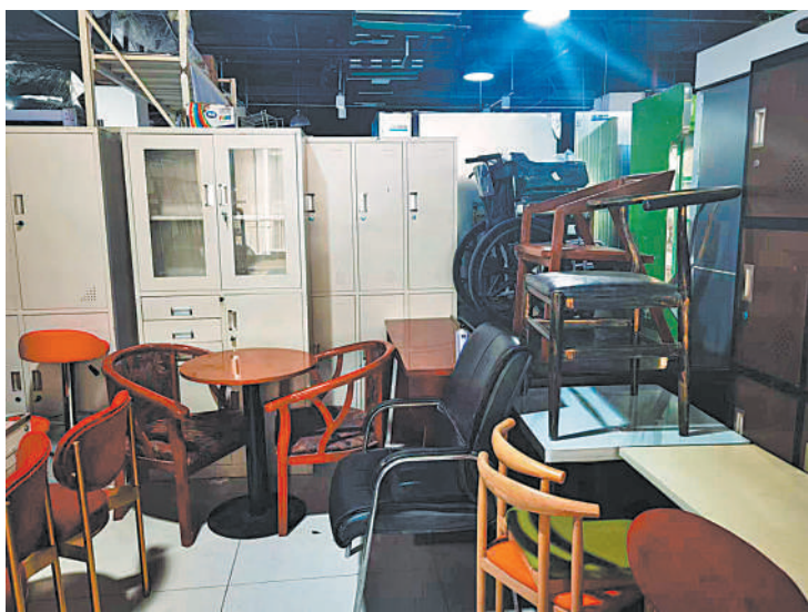
银川市一家旧货市场内售卖的家具。