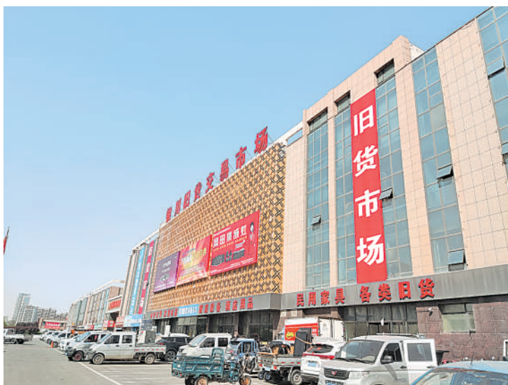
位于银川市清和街的旧货市场是全市最大的二手家具市场。