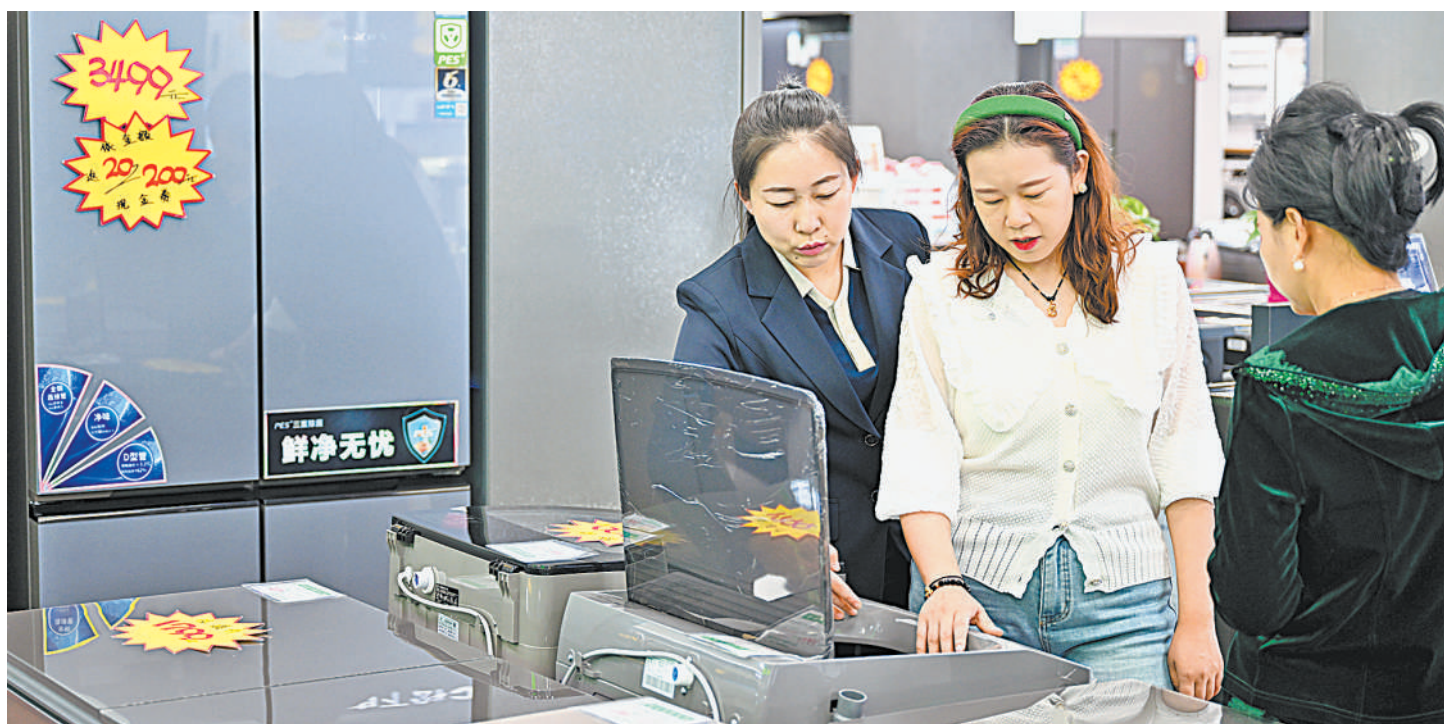
5月9日,市民在吴忠市利通区一家电卖场里选购洗衣机。近期,在政府、企业、商家等多方补贴优惠政策拉动下,有意愿换购家电的消费者数量明显增加。

或者其他具有许可性质的证件、移送适用行政拘留的环境违法案件、移送涉嫌环境犯罪案件等5种情形的企业,都会被一票否决。”自治区生态环境厅相关负责人介绍,各级生态环境主管部门与其他有关部门建立信用信息共享及失信联动惩戒机制,推动企业环境信用评价结果在行政许可、采购招标、评先评优、信贷支持等工作中广泛应用,促进企业主动提升环境信用等级。