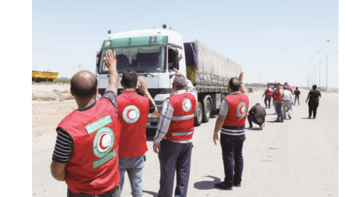
6月4日，在伊拉克拉马迪，伊拉克红新月会的工作人员向启程前往加沙地带运送货物的车队挥手致意。当日，35辆装载约500吨食品和医疗物资的卡车从伊拉克启程前往加沙地带，以帮助当地受困的巴勒斯坦民众。