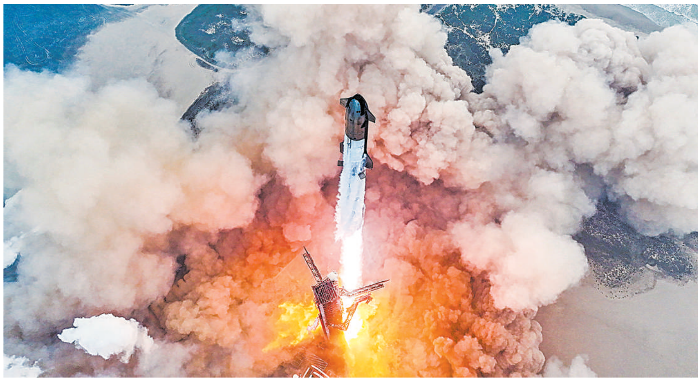
6月6日,“星舰”从位于美国得克萨斯州博卡奇卡的基地发射升空。