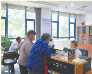
银川市档案馆工作人员接待查阅档案资料的市民。

“近几年来查阅档案的人越来越多。去年查阅量2000余人次,今年截至目前达800余人次,卷件使用量达500余卷、1700余件,涉及社保、复转军人、工商、公证、知青等多种涉及民生和专业档案服务领域。”保管利用科工作人员介绍,围绕智慧数字档案馆建设,银川市档案馆还将积极拓宽查档渠道,简化服务程序,让数据“多跑路”,群众“少跑腿”。