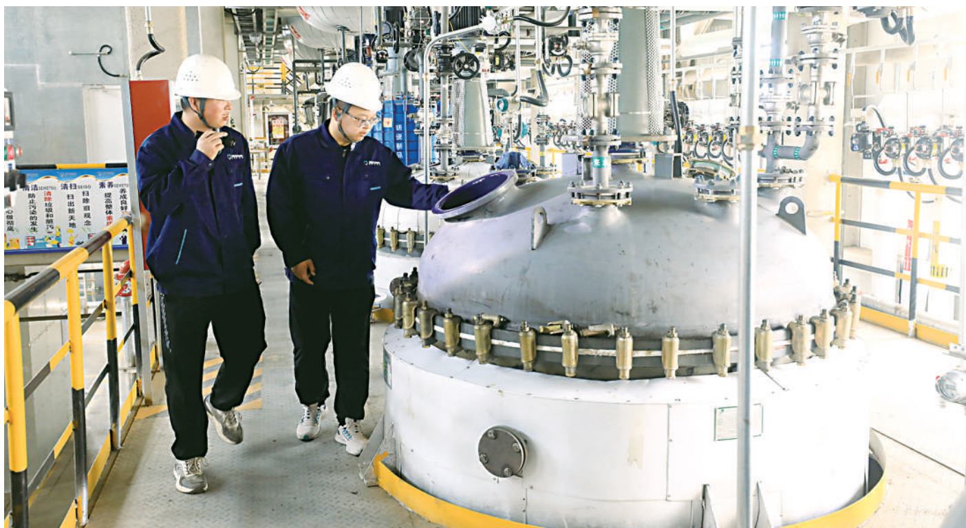
宁夏蓝博思化学技术有限公司技术人员在生产车间对设备进行巡检。

到了7月,宁夏蓝博思化学技术有限公司在今年2月向俄罗斯发完价值300万元的药品后,即将迎来新的订单。