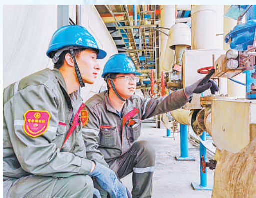
青年突击队检查设备。