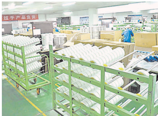
宁东基地致力打造“中国氨纶谷”。图为泰和氨纶生产车间。