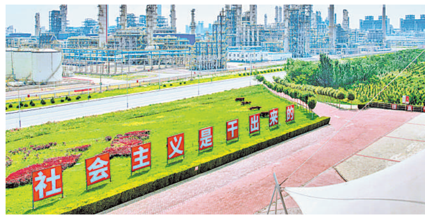
“社会主义是干出来的”爱国主义教育基地。

8年来,宁东基地用实干开启创新密码,走出了一条以绿能开发、绿氢生产、绿色发展为主的能源转型发展之路。宁东,正以科技创新推动产业创新,努力实现增长动力由要素驱动、投资驱动向创新驱动转换,加快推动“工业宁东”向“创新宁东”华丽转身。