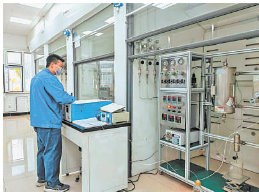
科研人员在中试基地实验室制作低温脱硝催化剂的成型剂条。