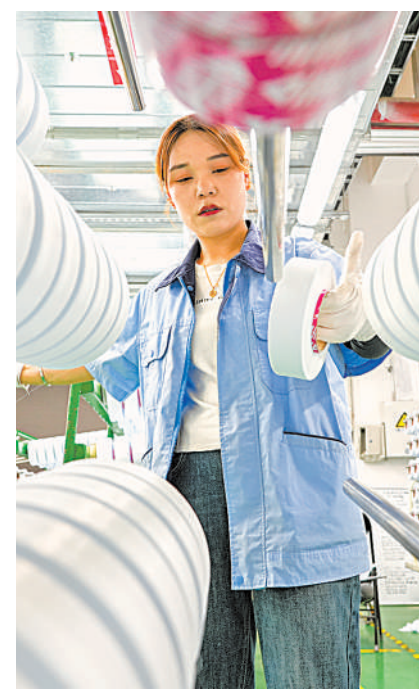
晓星氨纶一、二期项目已建成投产。图为工人在检查产品质量。

目前,宁东现代煤化工示范引领全国,成为目前全国最大的煤制油、煤基烯烃生产加工基地,现代煤化工总产能达到2800万吨以上,其中煤制油400万吨、约占全国一半,煤基烯烃420万吨、超过全国五分之一;220万吨MITO烯烃达到能效标杆水平、位列能效领跑者第一名,成功搭建了煤炭向石油化工产品转化的桥梁,打造全国最具潜力的高性能纤维生产基地,对位芳纶产能1.05万吨、全国第一,氨纶产能15.2万吨、全国第五,获评“中国氨纶谷”;精细化工产业茁壮成长,是西北地区规模最大、门类最全、种类最多、配套最全的精细化工产业基地;绿氢产能2.2万吨、全国第二。