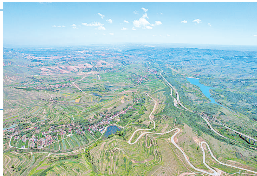
山路蜿蜒,村落有致,绿地蓝天,今日固原风光别样。