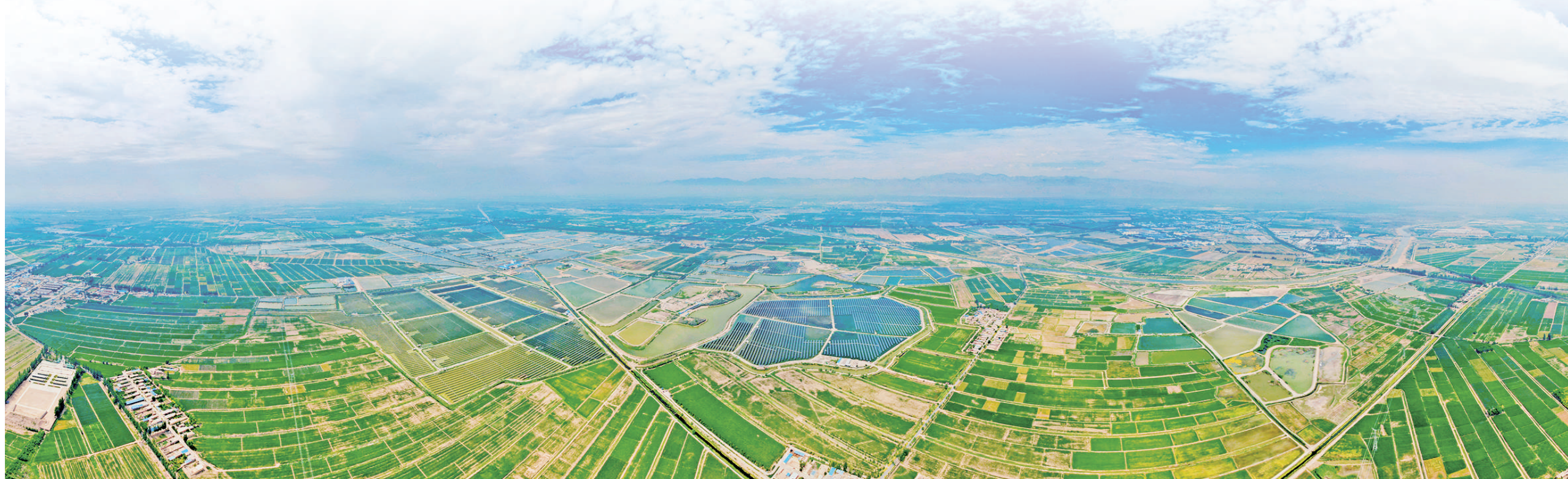
田园美景。