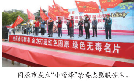
固原市成立“小蜜蜂”禁毒志愿服务队。

KTV、网吧、旅馆等容易滋生毒品违法犯罪活动的场所,开展百日专项整治,通过“线上+线下”宣传,多渠道、多形式提示消费者远离毒品、珍爱生命。同时,提升广大经营业主、从业人员对毒品违法犯罪的敏感度,畅通举报渠道,建立警民携手禁毒的“直通车”。