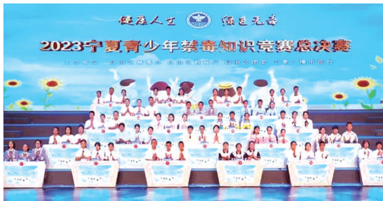
宁夏举办青少年禁毒知识竞赛总决赛。

禁毒工作事关国家安危、民族兴衰、人民福祉。近年来,面对严峻复杂的毒品犯罪形势和繁重艰巨的工作任务,全国禁毒部门忠实履职尽责,主动担当作为,推动禁毒工作取得明显成效。今年是新中国成立75周年,是实现“十四五”规划目标任务的关键一年,做好禁毒工作、减少毒品危害,对于捍卫政治安全、维护社会稳定、保障人民安宁具有重要意义。