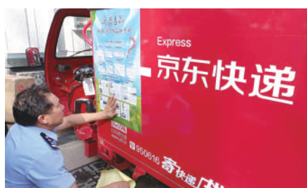
吴忠市禁毒宣传覆盖所有快递配送车。

估和“双四色”网格化动态管控机制,实现信息准确率、管控知晓率两个100%。四是紧盯涉毒群体,营造全民防毒围剿声势。针对吸贩毒群体,组织开展禁毒课、就业创业教育培训、禁毒专干走访宣传,组织涉毒人员参加禁毒公益服务、禁毒宣誓等活动,引导涉毒群体远离毒友圈。