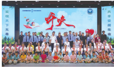
石嘴山市开展禁毒文艺巡演。

别在国家级各类媒体发稿500余篇,自治区级各类媒体发稿3000余篇,市级各类媒体发稿400余篇。“石嘴山禁毒”微信公众号连续17个月在全国地市级禁毒微信影响力排行榜前100名,全市抖音、快手、视频号等新媒体平台总粉丝量300余万。