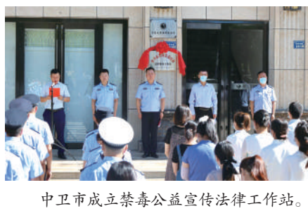
中卫市成立禁毒公益宣传法律服务站。

警律协作,提升禁毒执法工作质效。中卫市禁毒办牵头,工作站积极配合,律师志愿团队结合因证据问题或程序违法导致案件无法顺利进行的真实案例,反向举例,进一步加强禁毒执法规范化建设,切实提升禁毒民警业务技能和水平。