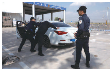
银川市禁毒民警开展毒品查缉。

拒毒基础更加厚实。创新构建立体化预防教育模式,锚定特色领域群体,策划“定制式”禁毒宣传教育活动,举办首届才艺大赛作品征集等禁毒主题活动,拓宽不同领域、不同行业群众对禁毒知识的认知度和参与度,实现禁毒宣传从“大水漫灌”到“精准滴灌”的转变。