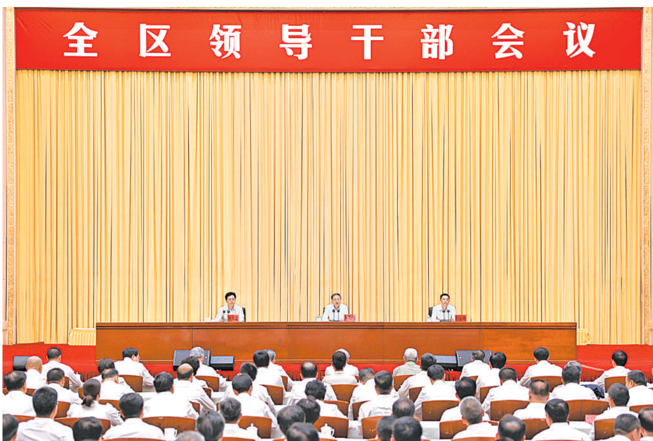
6月28日,自治区党委召开全区领导干部会议,宣布中央关于自治区党委主要领导调整的决定。本报记者 党硕 摄

李邑飞说,宁夏是祖国西部的一块宝地,是一片有着光荣革命传统的红色土地,也是一方充满希望的沃土。在新中国成立75周年的重要时刻,我有幸成为宁夏一员、为宁夏人民服务,深感使命光荣、责任重大。我一定牢记总书记谆谆教诲、殷殷嘱托,倍加珍惜党和人民赋予的宝贵机会,在以习近平同志为核心的党中央坚强领导下,全面贯彻党的二十届二中全会及二十届二中全会精神,紧紧依靠自治区党委一班人,与自