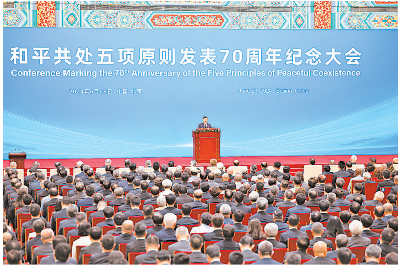
6月28日上午,和平共处五项原则发表70周年纪念大会在北京人民大会堂隆重举行。国家主席习近平出席纪念大会并发表题为《弘扬和平共处五项原则,携手构建人类命运共同体》的重要讲话。

新华社北京6月28日电 6月28日上午,和平共处五项原则发表70周年纪念大会在北京人民大会堂隆重举行。国家主席习近平出席纪念大会并发表题为《弘扬和平共处五项原则,携手构建人类命运共同体》的重要讲话。